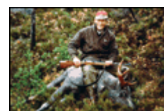
EKSklusiv ELGJAKT: Det er mulig for