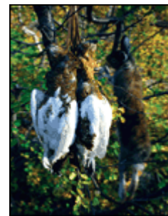
SATS LOKALT: En farbar vei til rypeparadiset er å flytte til Terråk. Medlemmer av Terråk JFF kan jakte på Plathes eiendommer...