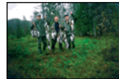
HØSTING: Plathes eiendommer byr på varierte muligheter.