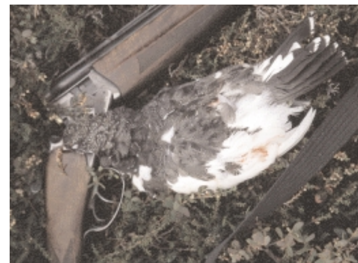
GRÅ SOM FJELLET: Mens lirypa er brun og hvit i sommerdrakta er fjellrypa noe mindre i størrelse og grå der dens litt større slektning er brun.

De blir enige om hvor kullet gikk inn for landing, og begynner oppstigningen på skrå mot stedet. Lyden av løse, flate steiner som triller mellom beina og nedover fjellskråningen blir ganske snart konstant.