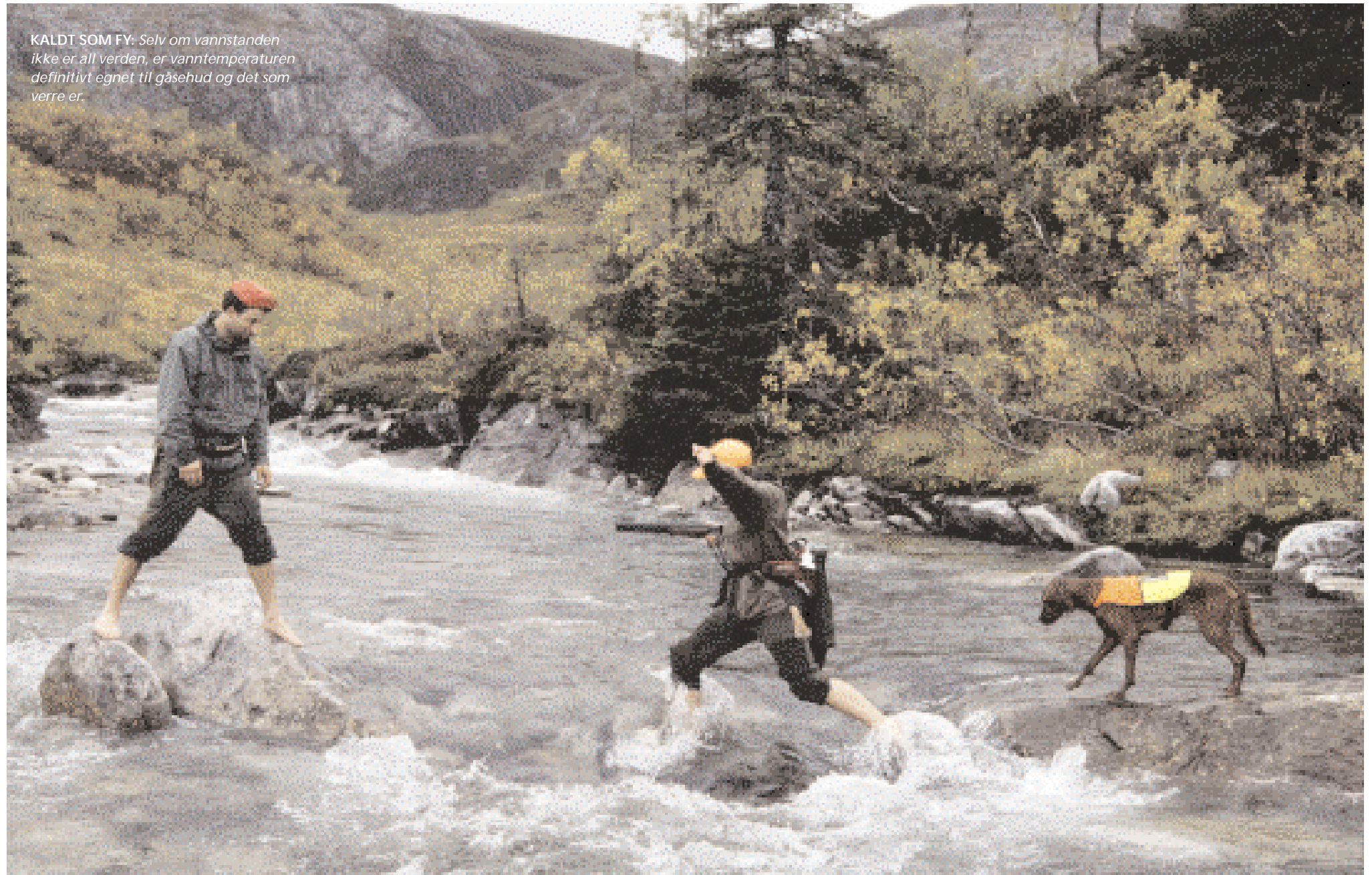
KALDT SOM FY: Selv om vannstanden ikke er all verden, er vanntemperaturen definitivt egnet til gåsehud og det som verre er.