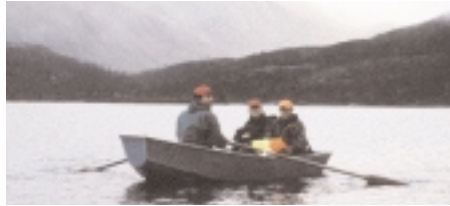
VAKKERT LANDSKAP: Nok en rotur var nødvendig for å komme oss fram til jakthytta ved Kalvkruvannet.