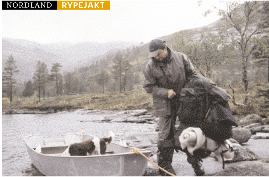
GREI FARKOST: Grunneier Plahtes eiendommer var hjelpsom og lånte oss en aluminiumsbåt så vi kunne ro alt pargasset over den første innsjøen.