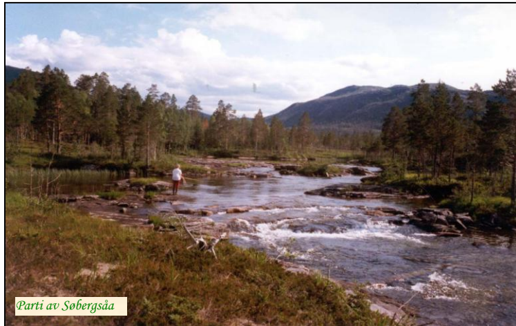
Parti av Søbergsåa

Den gamle laftede skogstua ligger i naturskjønne omgivelser ved Sørengvatn, langt fra nærmeste nabo. Det er et rikt pattedyr- og fugleliv, og det er ofte elg og rådyr nede ved vatnet. Det er flotte turmuligheter med fossefall, store kalkgrotter og flere kulturminner. Du kan nå kjøre bil til 20 m fra hytta. Vassdraget er laksførende til ca 600 m opp i Søbergsåa. Søbergsåa er 2 km lang fra Søbergsvatn via Sørengvatn til