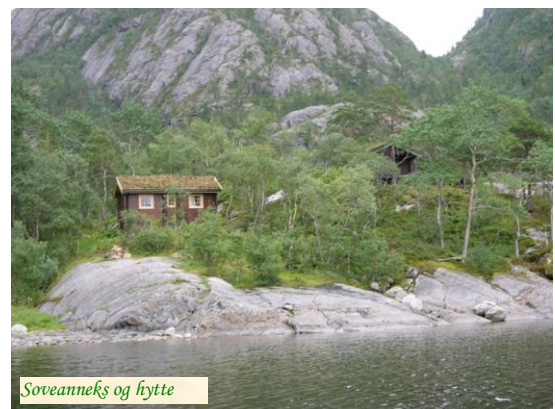
Soveanneks og hytte

Kartreferanse: M 711: Nr. 1825 III og IV. Hytta koordinater: UTM 7239200 – 33W0384260. Telefon til guide/skogbestyrer: 750 26261 eller 99 49 03 13. Flytevester er tilgjengelige etter forhåndsavtale. Det er kundens ansvar å følge forskriftene.