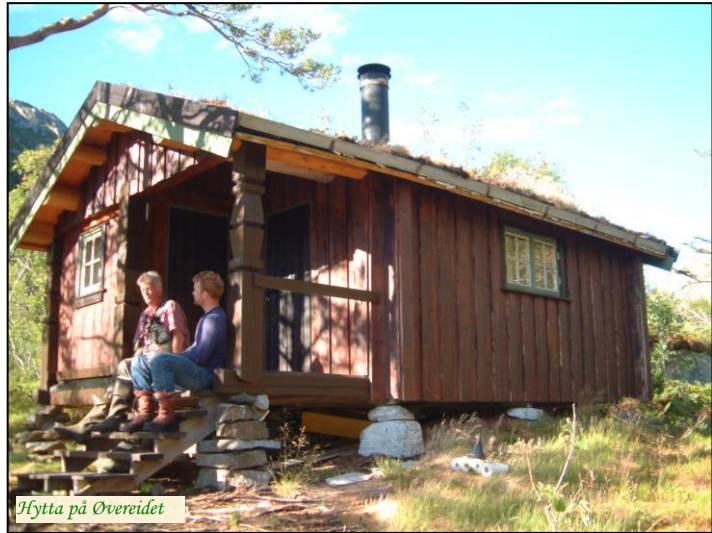
Hytta på Øvereidet

(Sørnskog) ca. 3 km, post og butikk (Hommelstø) 30 km, Brønnøysund Flyplass ca. 65 km.