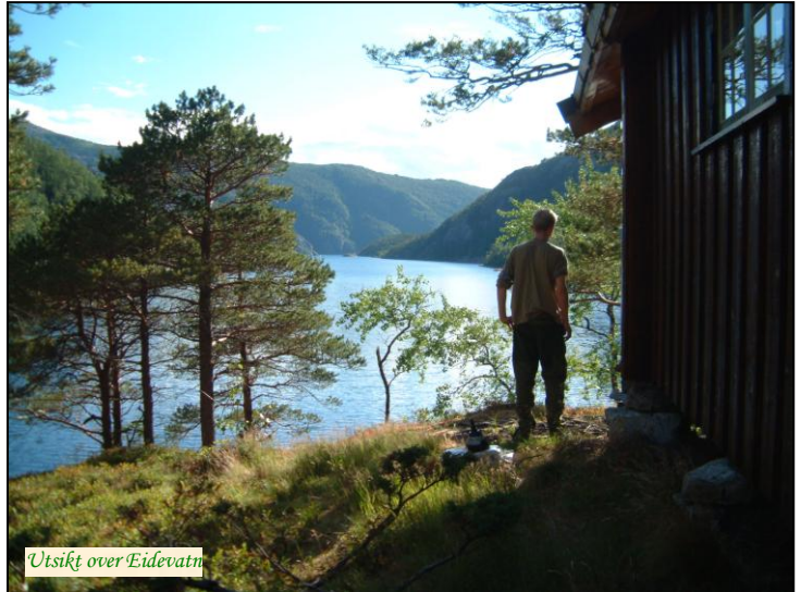
Utsikt over Eidevatn

I oppgangstiden er det vanligvis et godt fiske på Øvereidet . Elva er ca. 150 m. lang og ganske stri. I selve elva fiskes det mye med mark. I og rundt utløpsosen fiskes det også en del med flue. Den er en typisk sjørret- og smålakselv. Fisket i selve Øvereidelva varierer noe mer med vannføring enn på Sagmestereidet, mens fisket ved utløpet og i Eidevatn er mer stabilt. Like nedenfor hytta ligger Eidevatn , der fisket pleier å være meget godt. Det fiskes mye med amerikaner, langdrag, dorging med flue, mark og spinner. I vatnet har lokalbefolkningen tillatelse til å fiske i begrenset omfang. Fisket i Fjellvatnet og Storvatnet pleier også å være bra, og man benytter mye det samme utstyret som i Eidevatn. Gjester på Øvereidet har enerett til fiske fra nordsiden av Øvereidelva, og har fiskerett ellers i hele resten av vassdraget, unntatt på Sagmestereidet med Eideelva og de nærmeste 150 m rundt utløpsosen fra Eidevatn).