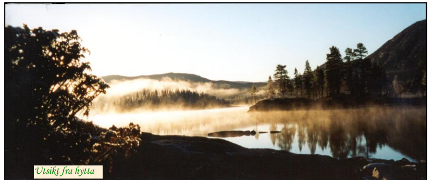
Utsikt fra hytta

K albekkvikka ligger ved Storvatnet, sentralt i naturperlen Vassbygda på Sør-Helgeland. Store arealer med vakker uberørt natur hvor få mennesker ferdes, kombinert med elver og vann som er kjent for meget godt fiske, setter rammen for fine opplevelser. Hytta er av god standard og har bilvei frem til døren.