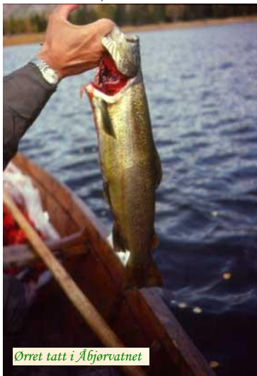
Ørret tatt i Åbjørvatnet

Åbjørvatnet er fiskerikt med ørret, og har en del røye. Det er vanlig med fisk i størrelsen 0,5-1 kg, men det er tatt ørret på over 4 kg. Området ellers er rene ørretvassdrag. I 2001 ble det bygget en lakstrapp nedenfor Åbjørvatn, slik at fisken nå kan gå uhindret opp til vannet. Allerede i 2002 ble det tatt sjørret og laks i Åbjørvatnet, men vi regner med at det tar noen år før vi ser full virkning av trappen. Foreløpig skal all laks settes ut, mens sjørretten kan beskattes.