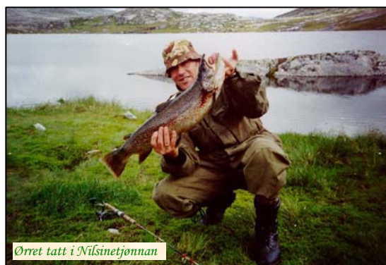
Ørret tatt i Nilsinetjønnan

Best fiske er det ofte i Mellavatn (309 moh) , Faatnoenjaevrie (594 moh) , Holmvatnet (532 moh) , Brennelvområdet og Kalvassfjellet , der det ligger en rekke tjern og vann med fisk av topp kvalitet.